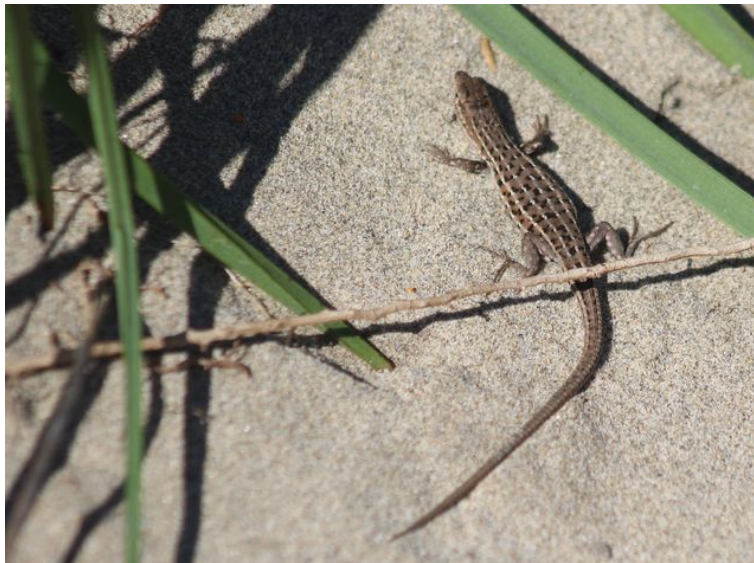
Figure 1 : Psammodrome d'Edwards dans les arrières dunes du secteur de Brasinvert, Saintes-Maries-de-la-Mer, 2017.

Dans les Bouches-du-Rhône, le Psammodrome d'Edwards est bien réparti sur l'ensemble du département. Ses