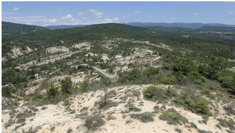
Habitat préférentiel du Psammodrome d'Edwards composé d'un sol calcaire et marneux d'âge Eocène-Oligocène, Forcalquier, 2018.

Viens, etc.), les contreforts du Mont Ventoux (communes de Caromb, Crillon-le-Brave, Bédoin, Beaumont-du-Ventoux, etc.), le Petit Luberon (communes de Cheval-Blanc, Mérindol, Puget, Ménerbes, Bonnieux, etc.) et le sud du Grand Luberon (communes de Lourmarin, Cucuron, Cabrières d'Aigues, Grambois, Beaumont-de-Pertuis). Dans le pays d'Apt, Volot (1980) précise qu'« il est un hôte caractéristique des truffières de chêne pubescent... » et qu'« il est fréquent dans les gravières et sablières » (notamment sur la commune de Goult). Il a récemment été observé dans le secteur des hauts plateaux de Sault et d'Albion sur le territoire des communes de Monieux (Gorges de la Nesque), Sault et Saint-Christol (Aubin et al., 2017) ainsi qu'à l'extrême sud-ouest du département sur la commune de Caumont-sur-Durance (St Symphorien). Il est absent du secteur de Pertuis allant de Villelaure à Mirabeau. Il atteint les 1130 m d'altitude à Lagarde-d'Apt (Olios 1993) ce qui représente la donnée la plus élevée en France ! (Geniez & Cheylan in Lescure & de Massary 2012). Alpes-de-Haute-Provence