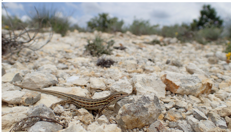
Psammodrome d'Edwards femelle en déplacement au sein de son habitat, Forcalquier (Astartant), 2018.

Dans les Alpes-de-Haute-Provence, le Psammodrome d'Edwards est localisé dans le quart sud-ouest du département. Il est essentiellement présent en rive droite de la Durance notamment dans la région de Forcalquier (communes de Revest-des-Brousses, Ongles, Limans, Mane, Pierrerue, Sigonce, etc.) (Fig.3 et 4) jusqu'à Simiane-la-Rotonde (limite ouest). Il s'étend sur le piémont de la montagne de Lure à Banon et Saint-Etienne-les-Orgues (Geniez & Cheylan in Lescure & de Massary 2012).