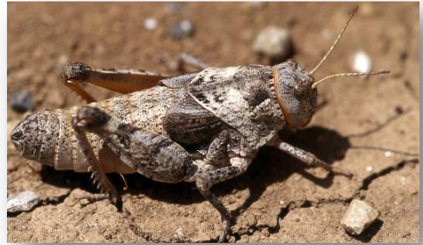
A gauche : Recherche du Criquet hérissron en juin 2014 – A droite : Prionotropis hystrix subsp. azami