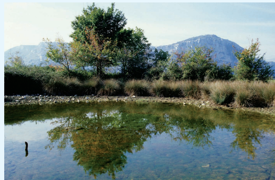
Le Domaine des Courmettes (06)

1200 ha répartis sur 5 sites sous convention ou en propriété propre. Ce département accueille une exceptionnelle biodiversité mais doit faire face, dans le même temps, à une très forte pression humaine (touristique, urbanistique...). Ces éléments sont pris en compte et intégrés lors de l'élaboration des mesures de gestion sur des sites fortement contrastés, à l'image du département.