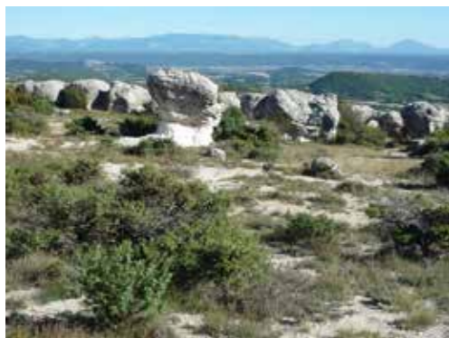
Site des Mourres

Une matinée à la découverte du site original des Mourres (commune de Forcalquier dans les Alpes-de-Haute-Provence) est prévue le samedi 30 mai 2015 à partir de 10h.