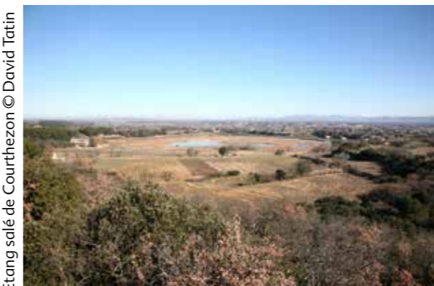
Etang salé de Courthézon