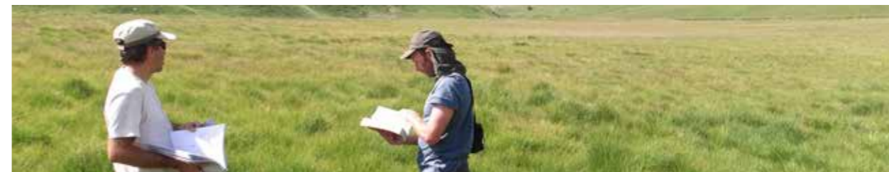
Terres Pleines

• Le Conservatoire d'espaces naturels de Provence-Alpes-Côte d'Azur (CEN PACA), créé en 1975, est une association à but non lucratif, d'intérêt général. Agréé au titre de la protection de la nature dans un cadre régional, il a pour objectif la préservation du patrimoine naturel de la région Provence-Alpes-Côte d'Azur.