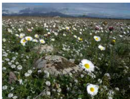
La Crau