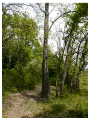
Chêne crénata