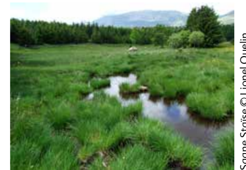
Sagne Staïse