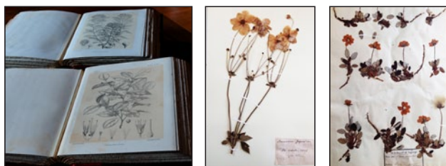
Planches d'herbier

Les bénévoles de l'atelier de restauration de l'herbier historique de Monsieur Thuret, membres de l'Association des Amis du Jardin Thuret, présentent leurs activités de conservation du patrimoine.