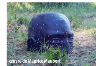
œuvre de Maurice Maubert

En savoir plus : https://no-made.net/ et https://www.no-made.eu/