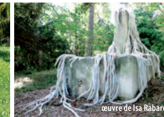
œuvre de Isa Rabarot