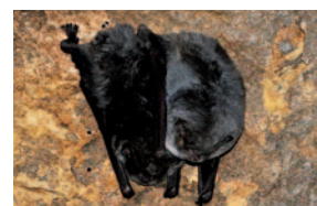
Minoptères de Schreibers, Roquefort-les-pins