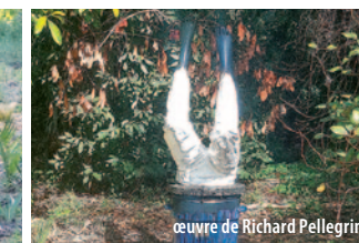
œuvre de Richard Pellegrino