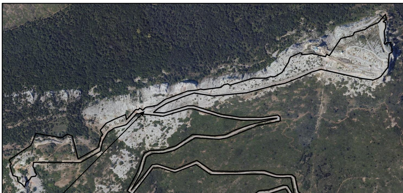
Emplacement de la future aire de stationnement