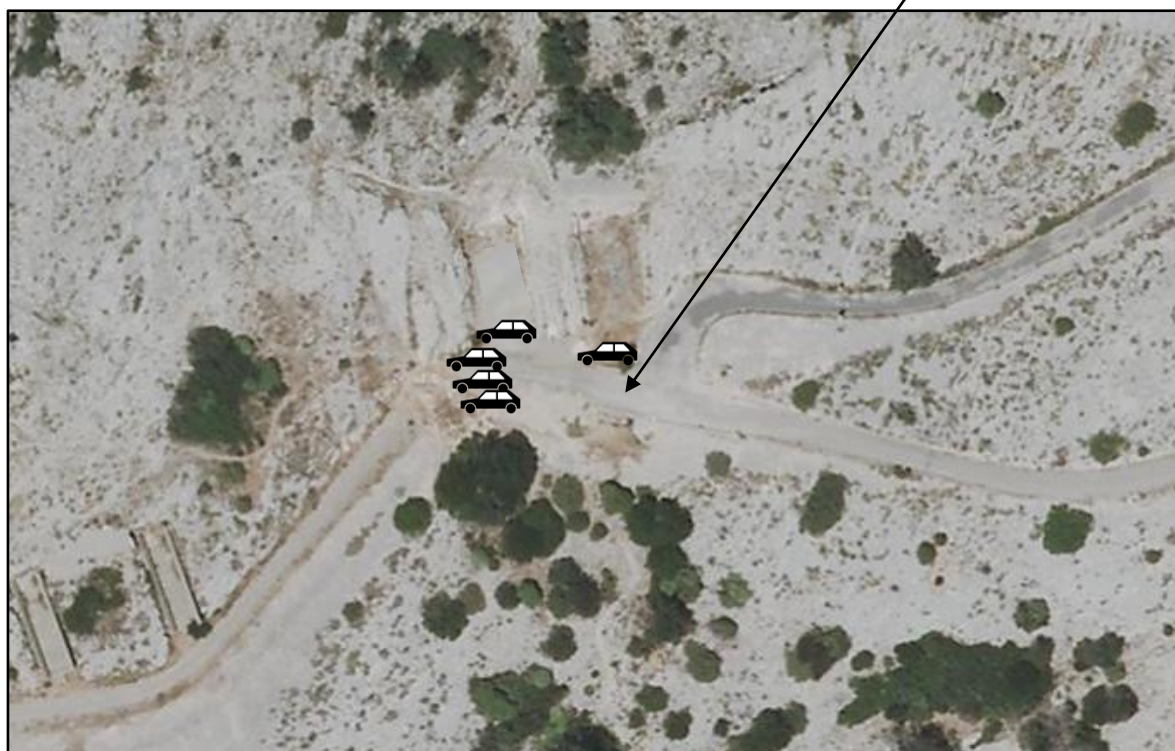
Localisation précise de la future aire de stationnement