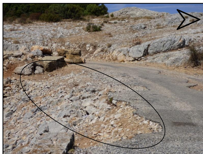
Accotement de la route à reprendre