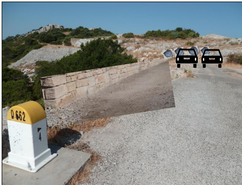
Exemple d'ouvrages souhaités