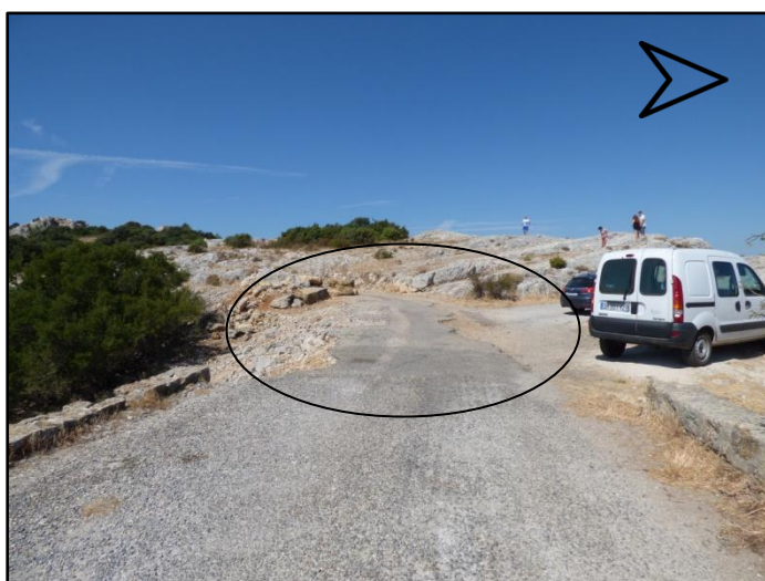
Configuration actuelle de l'aire de stationnement

Les photos et schémas suivants présentent la configuration actuelle de l'aire de stationnement et les aménagements attendus.