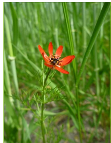
Adonis Adonis flamea

Le site des Mourres, est un Espace naturel sensible du Département des Alpes de Haute-Provence où le Conservatoire d'espaces naturels de Provence-Alpes-Côte d'Azur (CEN PACA) intervient depuis 2004. La commune de Forcalquier, qui est devenue propriétaire, a souhaité s'associer au CEN PACA au travers d'une convention d'objectifs depuis 2008. Le CEN PACA travaille également aux côtés du Conservatoire National Botanique Alpin (CBNA) sur un programme de conservation des messicoles par la création de « cultures conservatoires à messicoles » avec le soutien et le concours de l'agricultrice et propriétaire des parcelles.