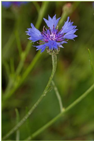
Bleuet Cyanus segetum

Les plantes messicoles – du latin « messis », moisson, et « colo », habiter – sont des espèces spécialisées des cultures de céréales, vignes ou olivettes. Les changements de pratiques agricoles, notamment l'utilisation des pesticides et le tri des semences, ont entraîné leur raréfaction. Plusieurs d'entre elles sont protégées. Ce n'est pas le cas du coquelicot et du bleuet qui restent encore assez courants dans les champs en Provence. Outre leur participation à l'enrichissement de la biodiversité, leur rôle nourricier et d'habitat pour les insectes, oiseaux et mammifères, ces plantes sont utilisées à des fins alimentaires (graines de coquelicot ou nigelle pour parfumer salade et pains) et/ou pharmaceutiques (adonis en homéopathie et bleuet pour le soin des yeux).