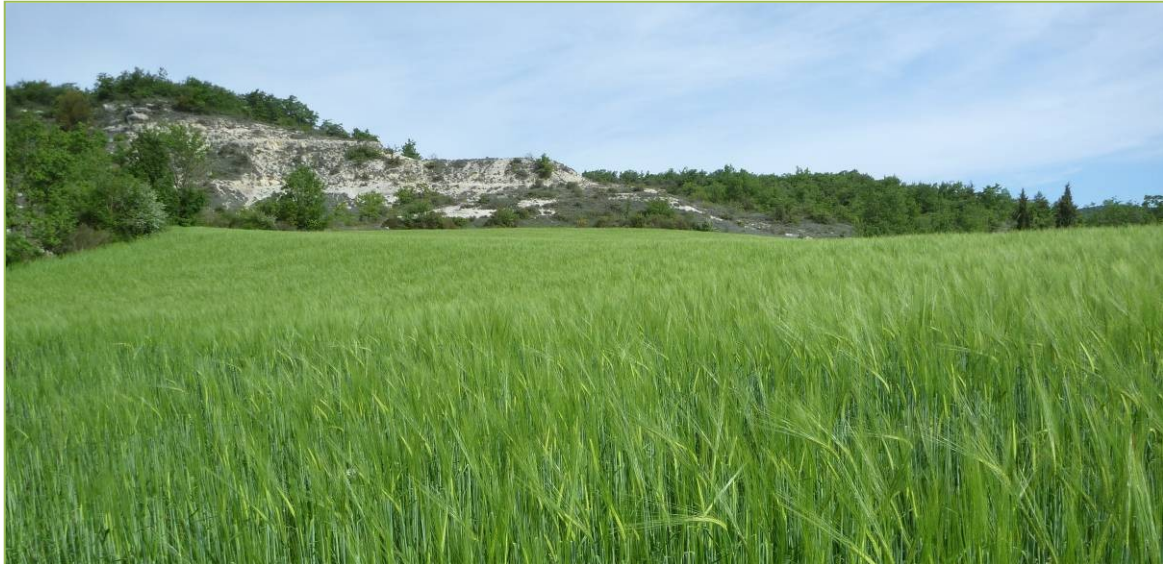
Prairie conservatoire à messicoles des Mourres en 2014

Les salariés de L'Occitane participeront à la reconversion d'une ancienne parcelle agricole par l'ensemencement manuel en culture de céréales d'hiver contenant des graines à messicoles de semences locales.