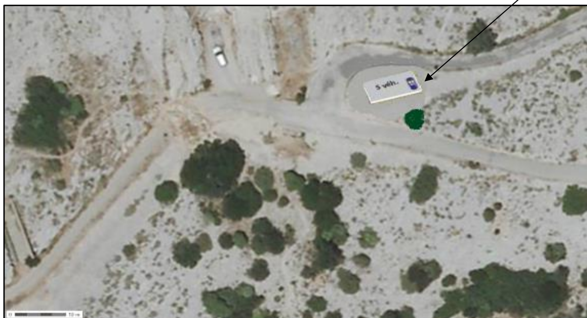
Localisation précise de la future aire de stationnement