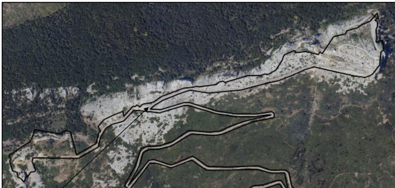
Emplacement de la future aire de stationnement