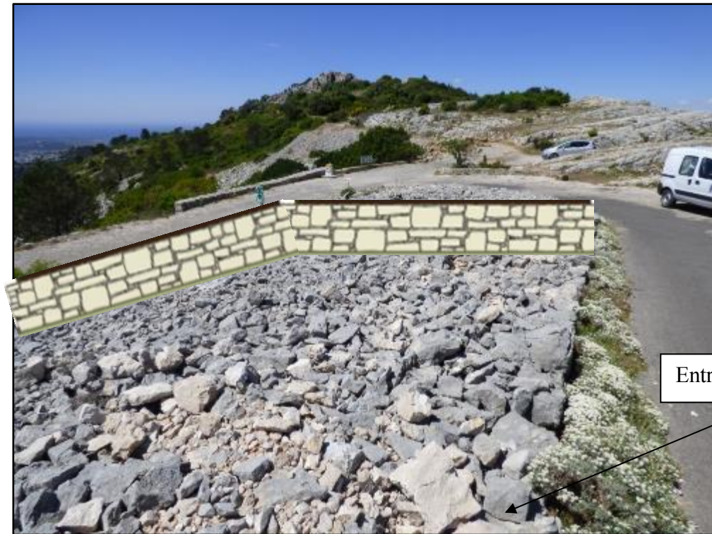
Exemple de muret souhaité en pierres maçonnées