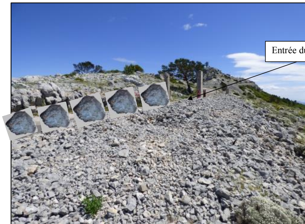
Exemple de blocs rocheux souhaités