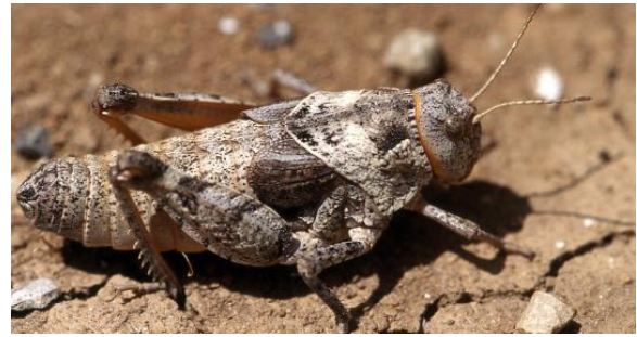
A gauche : Recherche du Criquet hérisson en juin 2014 – A droite : Prionotropis azami