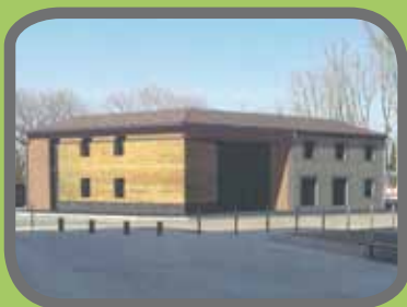
Maquette du projet de rénovation

Géré par le Conservatoire d'espaces naturels de Provence-Alpes-Côte d'Azur, l'Ecomusée de Saint-Martin-de-Crau a pour but la mise en valeur et la sauvegarde du patrimoine naturel et humain de la Crau. Il présente les richesses et les traditions de ce milieu si particulier : sa géologie, sa faune rare et protégée, sa flore, son histoire. L'Ecomusée est également le point de départ des sorties nature ou des visites libres de la Réserve naturelle nationale des Coussouls de Crau.