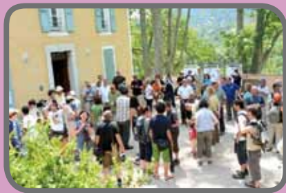
Assemblée générale 2013, Parc régional du Luberon