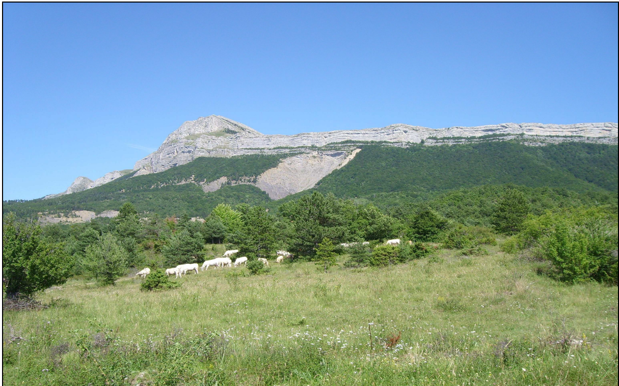
Le massif des Dourbes : une mosaïque d'habitats situés entre 800 et 1700 mètres d'altitude.

L'inventaire sera ciblé sur les prairies et la hêtraie du Défens placées en zone d'Arrêté de Protection de Biotope depuis 1988, ainsi que la ligne de crête. Ces données viendront enrichir la base de données communale faune-flore.