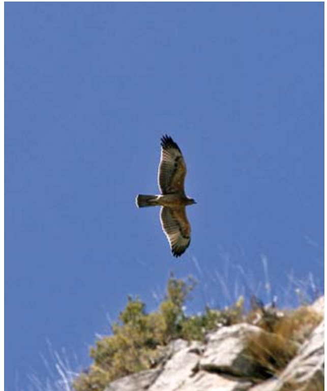
Photos 1 et 2 : Détails des ailes d'Aigles de Bonelli Aquila fasciata de un an, à gauche le 10 juillet 2011 (© J.C. Tempier), à droite le 25 juillet 2007 (© A. Flitti). Ils garderont ce plumage jusqu'au printemps suivant. Ces deux individus montrent une nette différence de coloration des grandes couvertures. Photos 1 and 2: Wing details of one-year Bonelli's Eagles Aquila fasciata , on the left, July 10 2011 (© J.C. Tempier), on the right July 25 2007 (© A. Flitti). They will keep this feathering till the following spring. Those two birds show clear differences in the coloration of the greater coverts.