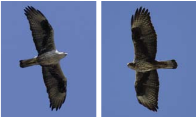
Photos 11 et 12 : Aigles de Bonelli Aquila fasciata de cinq ans, mâle à droite le 18 mars 2009 (© J.C. Tempier) et femelle à gauche le 7 mai 2012 (© M. Magnier). Les femelles sont généralement plus sombres que les mâles principalement sur les couvertures sous-alaires et les cuisses. On note deux zones plus sombres parmi les rémiges au centre des ailes, il s'agit de S1 et S5-6 nouvellement muées. Photos 11 and 12: Fifth-year Bonelli's Eagles Aquila fasciata , male on the right, March 18 2009 (© J.C. Tempier) and female on the left, May 7 2012 (© M. Magnier). Females are generally darker than males, mostly on the underwing coverts and the thighs. Notice two darker areas among the central remiges, the newly moulted S1 and S5-6