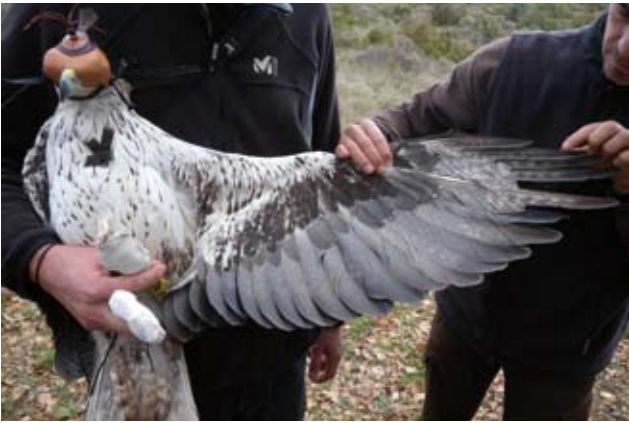
Photos 14 and 15: Sixth-year male Bonelli's Eagle Aquila fasciata on the right, March 31 2012 ; on the left, seventh-year female, March 26 2012. The male shows clearly 2 stages of feathers on the secondaries and probably on the primaries. All internal remiges are new.