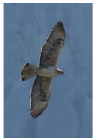
Photos 8 et 9 : Deux Aigles de Bonelli Aquila fasciata mâles de quatre ans, à droite le 3 mars 2013, à gauche le 8 avril 2011. Les rémiges sont toutes de la même génération, mais S1 et S5 sont plus courtes et plus claires car elles sont déjà anciennes. On distingue deux générations de rectrices de deuxième et troisième cycles de mue.