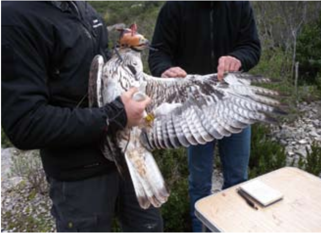
Photo 10 : Aigle de Bonelli Aquila fasciata mâle en fin de quatrième année, le 7 décembre 2011 (© N. Vincent-Martin). Il aura le même type de plumage en début de cinquième année. Les S1, S5, S6 et S7 sont neuves. Les P1 à P6 sont de même génération, mais les P1 et P2 sont déjà vieilles. Les P7 à P10, nettement usées, sont de la génération précédente. Photo 10: Fourth-year male Bonelli's Eagle Aquila fasciata , December 7 2011 (© N. Vincent-Martin). It will have the same feathering at the beginning of its fifth year. S1, S5, S6 and S7 are new. P1 to P6 are of the same generation, but P1 and P2 are already old. P7 to P10, clearly used, are of the previous generation.

Les couvertures sous-alaires présentent encore un fond de couleur chamois à blanc crème chez certains mâles alors qu'elles sont blanches chez d'autres et les femelles. La couleur des tectrices du ventre est nettement dominée par le blanc. Il faut un examen précis de ces plumes pour détecter encore des traces de marron-roux sur certaines d'entre elles (photo 13).