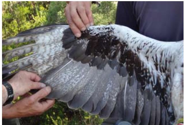
Photo 18 : Aigle de Bonelli Aquila fasciata mâle de 14 ans le 6 novembre 2009. A cet âge les vermicules sont très présents sur les primaires et apparaissent sur les secondaires.