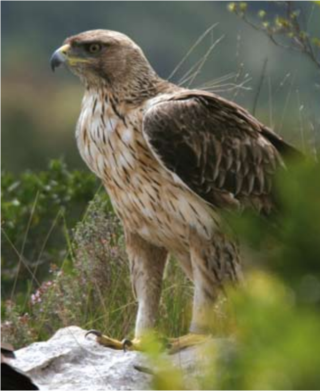
Photo 6 : Aigle de Bonelli Aquila fasciata mâle de trois ans le 14 mai 2008. Le ventre n'a pas totalement mué et présente des plumes nettement rousses et d'autres à dominance blanche. Un peu plus tard dans l'année, le ventre se sera nettement éclairci, au moins pour certains individus.