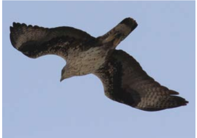
Photos 14 et 15 : A droite, Aigle de Bonelli Aquila fasciata mâle de six ans le 31 mars 2012 ; à gauche, femelle de sept ans le 26 mars 2012. Le mâle présente nettement deux stades de plumes sur les secondaires et probablement sur les primaires. Toutes les rémiges les plus internes sont récentes.