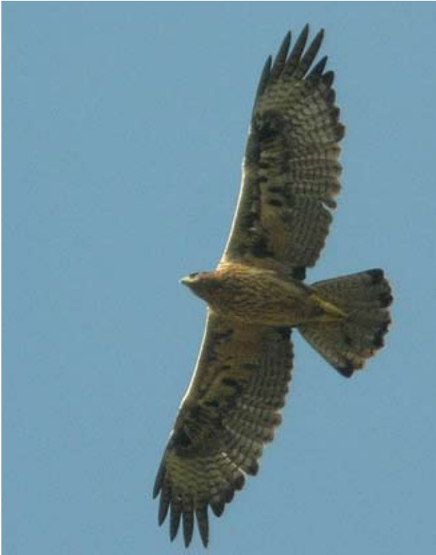
Photo 3 : Aigle de Bonelli Aquila fasciata de deux ans en mue le 07 septembre (2006). Les RP internes ont déjà mué et présentent une tache terminale noire. Seules les RS les plus internes ont mué. On remarque nettement le « patchwork » des couvertures sous-alaires neuves et juvéniles sur cet individu.

La queue présente deux générations de rectrices ; juvéniles à bout clair et de seconde génération à bout noir.