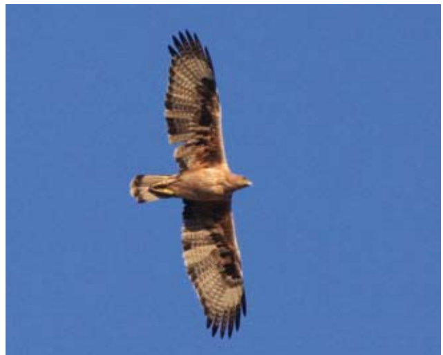
Photos 4 et 5 : Aigles de Bonelli Aquila fasciata de trois ans, à gauche mâle le 24 février 2010 (© M. Magnier), et à droite femelle probable le 31 mars 2012 (© S. Durand). Le mâle de gauche présente des taches terminales des RP internes peu marquées comparé à l'oiseau de droite. On note aussi la présence de deux générations de secondaires, S1, S2, S5 et les internes sur l'oiseau de gauche et S1, S2, S4?, S5, S6 et les internes sur l'oiseau de droite sont neuves. Elles contrastent avec les autres RS juvéniles. On note la présence de deux générations de rectrices (juvéniles et de première mue) sur l'oiseau de gauche.

Photos 4 and 5: Third-year Bonelli's Eagles Aquila fasciata , on the left a male, February 24 2010 (© M. Magnier), on the right a likely female, March 31 2012 (© S. Durand).