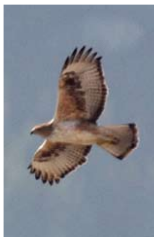
Photo 7: Fourth-year female Bonelli's Eagle Aquila fasciata , February 5 2013. Presence of brown-red feathers on the belly, around central sparks. Covers are still clearly fawn. All remiges are from the same generation except P1 to P3 that are new. Differences in coloration and size of the RS are clearly visible with S1 and S5 clearer and smaller.