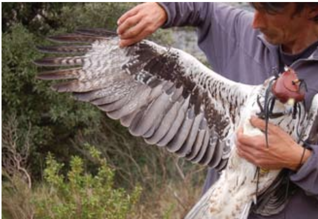
Photo 17: Eleven-year old female Bonelli's Eagle Aquila fasciata , June 11 2009