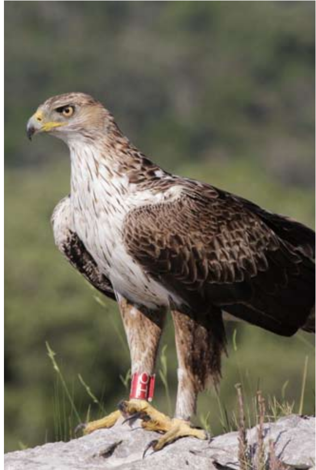
Photo 13 : Aigle de Bonelli Aquila fasciata femelle de cinq ans le 5 juin 2012 (© D. Lacaze). Des traces de roux subsistent sur quelques plumes de la poitrine Photo13: Fifth-year female Bonelli's Eagles Aquila fasciata , June 5 2012 (© D. Lacaze). Red feathers are still visible on the breast.