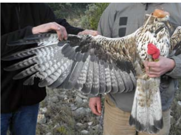
Photo 7 : Aigle de Bonelli Aquila fasciata femelle de quatre ans le 5 février 2013. On note la présence de marron-roux sur les plumes du ventre autour des flammèches centrales. Les couvertures sont encore nettement fauves. Toutes les rémiges sont de même génération sauf les P1 à P3 neuves. La différence de coloration et de taille des RS est nettement visible avec une S1 et S5 nettement plus claires et plus petites.

d'abord P1 vers l'extérieur, S13 vers l'extérieur, et S1 et S5 vers l'intérieur. Ces nouvelles plumes sont d'apparence plus sombre que la génération précédente, avec notamment les barres transversales noires qui s'élargissent. D'une mue à l'autre, les plumes s'assombrissent, mais, semble-t-il, aussi lors du même cycle de mue. Ainsi, dans le même cycle de mue, la dernière plume muée sera plus sombre que la première (photo 7).