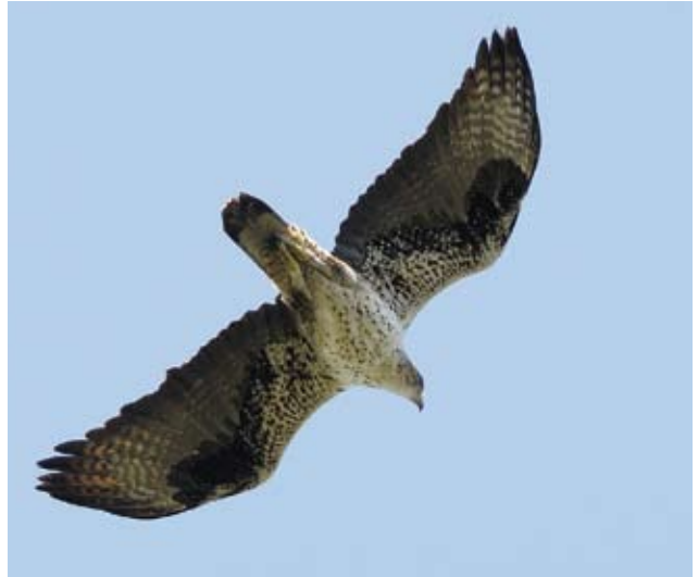
Photo 16 : Aigle de Bonelli Aquila fasciata femelle de 10 ans le 7 décembre 2011. Les rémiges sont quasiment entièrement sombres, gris ardoise, avec une barre de fuite large et plus foncée. Des vermicules apparaissent notamment sur les primaires. La mue semble plus complexe, ou s'agit-t-il simplement « d'accidents » ?